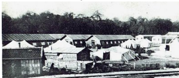
Hôpital de Villers-Daucourt