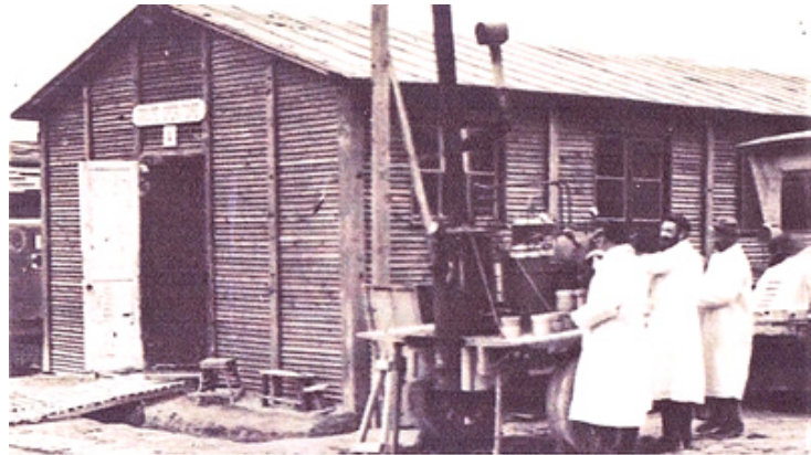
Ambulance chirurgicale, groupe électrogène, hôpital d'Auve

A partir du 26, un véritable flot de blessés arriva. Dans notre ferme, nous en avons logé trente le 27, soixante-quinze le 28. Après l'évacuation des premiers blessés le 6 octobre, nous en avons logé cinquante jusqu'au 15. Il en fut de même dans toutes les fermes de la rue ainsi qu'au presbytère et à l'église. Le chœur de l'église fut recouvert de paille pour une vingtaine de grands blessés couchés corps contre corps. Ils ne restaient pas longtemps, remplacés par d'autres. Tous les matins j'allais servir la messe à des prêtres soldats et en passant près d'eux, il y avait très peu de signes de vie.