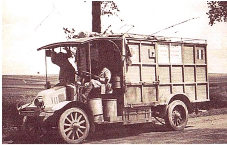
Camion de stérilisation et radiographie, hôpital d'Auve

Revenons dans notre secteur et au témoignage écrit de Jean Francart. Voici des extraits de ce qu'il a vu et ressenti pendant la bataille de Champagne du 25 septembre au 6 octobre et cela jusqu'au 12 octobre 1915, étant alors âgé de 10 ans :